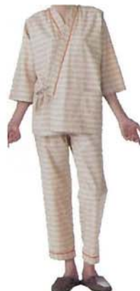
患者衣 (上下タイプ)