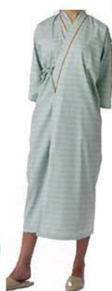
患者衣 (ガウンタイプ)