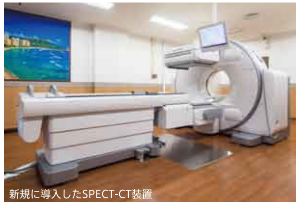
新規に導入したSPECT-CT装置

平成30年3月に、X線CT組合せ型SPECT装置(以下、SPECT-CT装置、左写真)を導入しました。