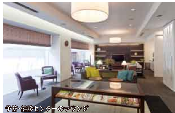
予防・健診センターのラウンジ

当院の予防・健診センターでは、平成30年1月から、1日コースと半日コースの土曜日ドックを毎月第4土曜日に実施しています。両コースとも検査項目は平日ドックと同様で、特に1日コースは胃カメラ検査を標準設定とし、半日コースは、ペプシノーゲン法と血中ピロリ抗体検査により胃がんのリスクを判定します。効率よく健康状態を知りたいかたには、半日コース(午後2時から2時間ほど)がお勧めです。