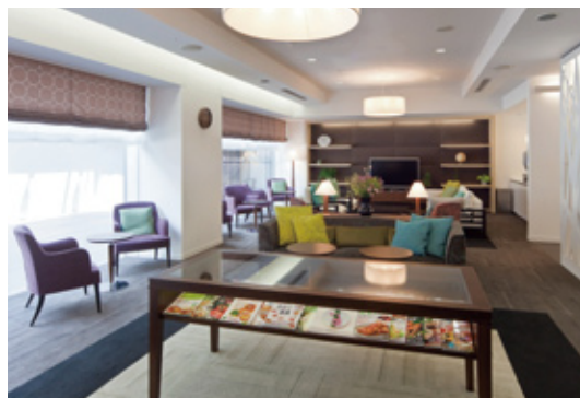
予防・健診センターのラウンジ