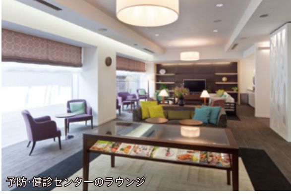
予防・健診センターのラウンジ

公立昭和病院では、午後の2時間で受診いただける半日人間ドックを行っています。ドック学会の定める基準から、血液検査を中心にした部分を取りだし、医師の診察、結果説明は1日ドックと同様に、最小限の時間で最大限の情報をお伝えするドックです。最新のペプシノーゲン法により、胃癌になりやすいかどうかも判定しています。精密検査が必要な場合は、専門科をご紹介します。構成市にお住まいの方は、構成市住民料金でご利用いただけます。