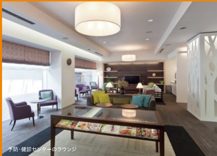
予防・健診センターのラウンジ

当院の予防・健診センターは、健診施設機能評価の認定を受けている健診施設です。人間ドックをはじめとして、脳ドック、半日ドック、経鼻内視鏡検査、CTによる大腸検査など専門の医師による質の高い健診を提供しております。現在、感染症専門医の意見を踏まえ、健診を実施しております。