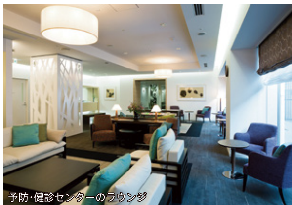
予防・健診センターのラウンジ

当院では、様々な院内感染対策を講じながら、皆様に安心して受診していただける体制を整えて、人間ドックを実施しております。