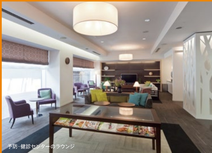
予防・健診センターのラウンジ

当院の予防・健診センターは、健診施設機能評価の認定を受けている健診施設です。人間ドックをはじめとして、脳ドック、半日ドック、経鼻内視鏡検査、CTによる大腸検査など専門の医師による質の高い健診を提供しております。現在、感染症専門医の意見を踏まえ、健診を実施しております。